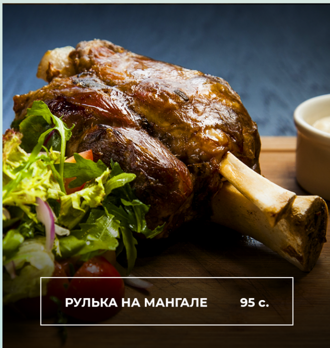
РУЛЬКА НА МАНГАЛЕ 95 с.