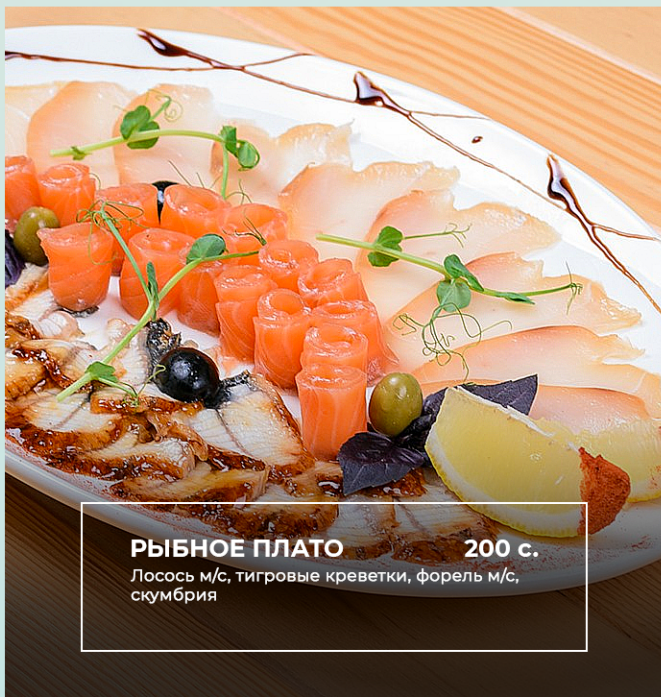
РЫБНОЕ ПЛАТО 200 с. Лосось м/с, тигровые креветки, форель м/с, скумбрия